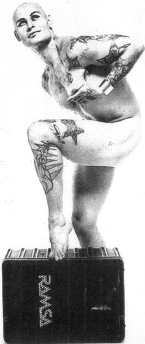
Jean-Luc Verna, Autoritratto , 2000

Più eclettico e onirico è invece il corpo inventato da Jean-Luc Verna (Nizza, 1966) quale ci introduce in un universo in costante opposizione ai modelli convenzionali. Ispirandosi nel contempo a Ingres, a Marguerite Duras e a Siouxsie and the Banshees, Verna congiunge elegantemente cultura tradizionale con quella underground, la cultura popolare con quella elitaria. I suoi disegni, risaltati con cipria e ai prodotti cosmetici, danno vita a creati ibride, icone e vanità che svelano le nostre pulsioni, le nostre paure e i nostri sogni.