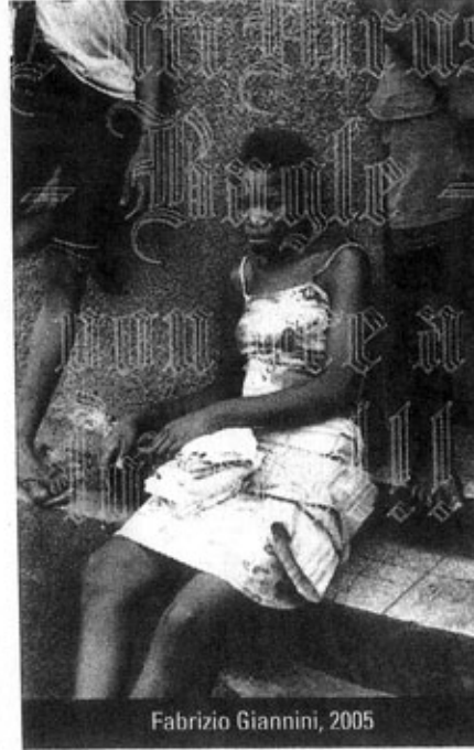
Fabrizio Giannini, 2005

le opere di tre artisti. Conosciuto per i suoi lavori sui logotipi di alcune grandi compagnie commerciali, logotipi che l'artista ha ricomposto utilizzando dei testi critici contro le compagnie stesse, Fabrizio Giannini (Lugano, 1964) si interessa più recentemente al fenomeno degli hackers e dei virus informatici. Attraverso le immagini e le installazioni realizzate per l'esposizione, l'artista confronta due realtà distinte: la realtà dei paesi più poveri dove virus e guerre agiscono spietatamente sul corpo umano, e la realtà occidentale dove i virus informatici e la guerra tra hackers rivali sembrano piuttosto i capricci di una classe privilegiata, la quale detiene comunque il potere di influenzare il destino economico e sociale del mondo.